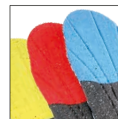
HAIX® Vario Wide Fit System