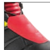
HAIX® 3Z Protector System