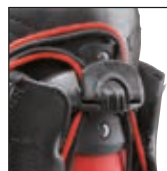
HAIX® FL Fit System