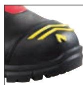
HAIX® High Durability Cap System