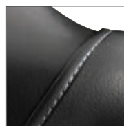
Protection de l'embout de sécurité avec encoche pour coutures